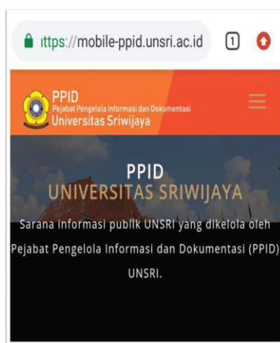
Gambar 9 Aplikasi PPID Universitas Sriwijaya versi mobile